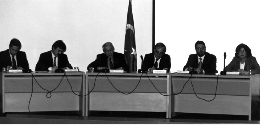
Bilgi Günü Paneli: Kızıltay, Eczacıbaşı, Pak, Ktenas, Bosco, Doğaç