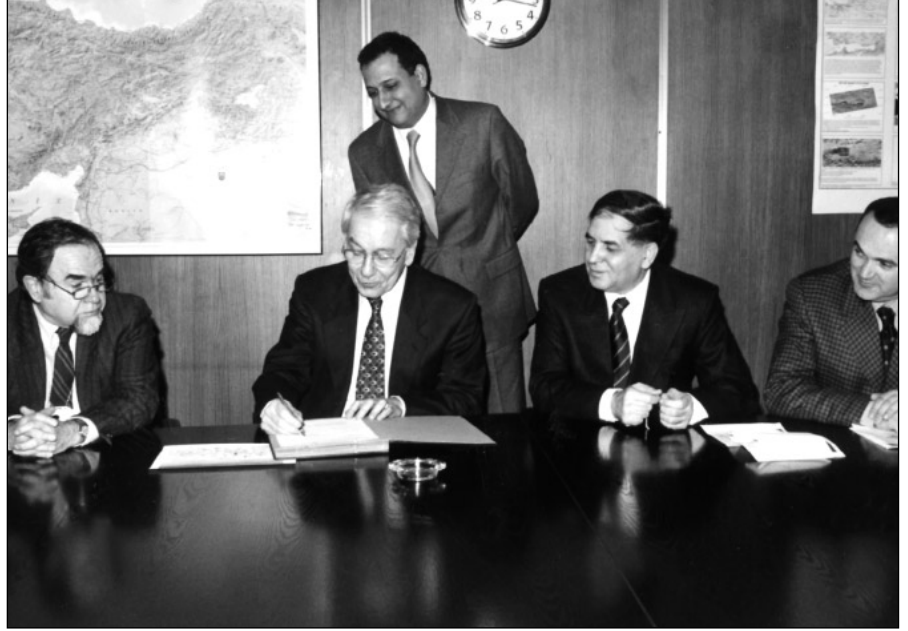
TÜBİTAK - SSM İmza Töreni