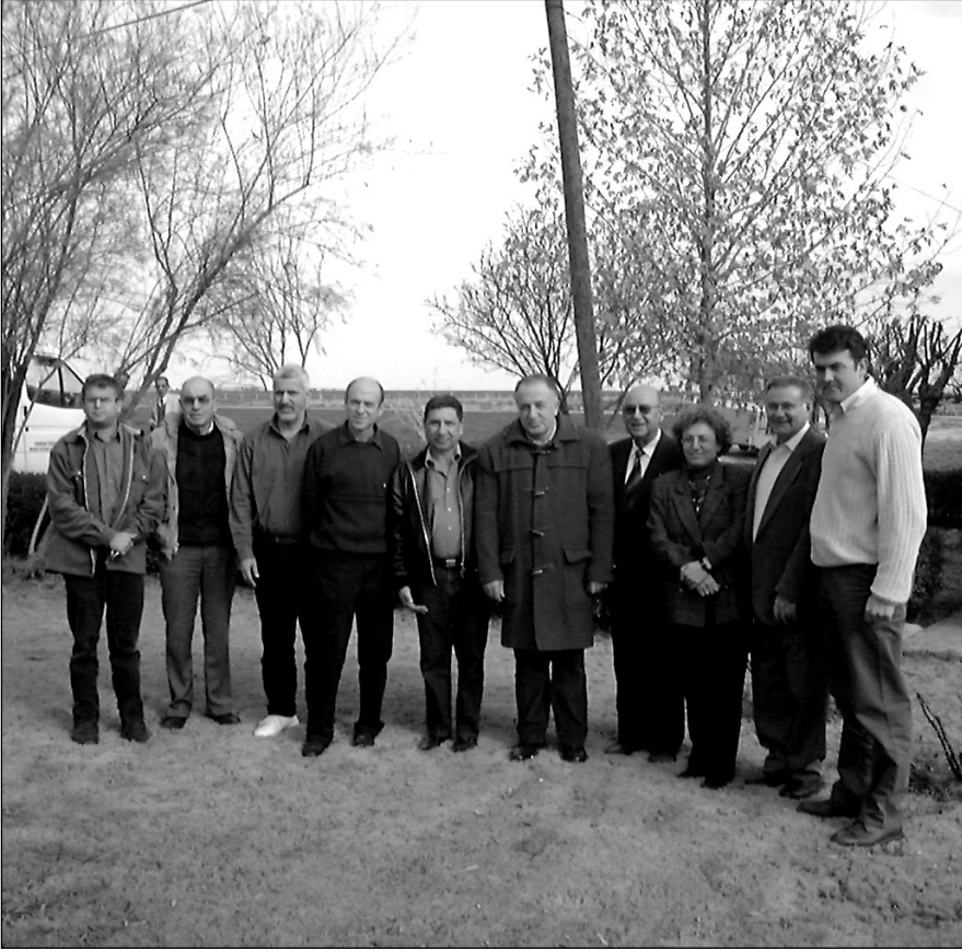
Türk ve İsraili bilim insanları Şanlıurfa'da arazide