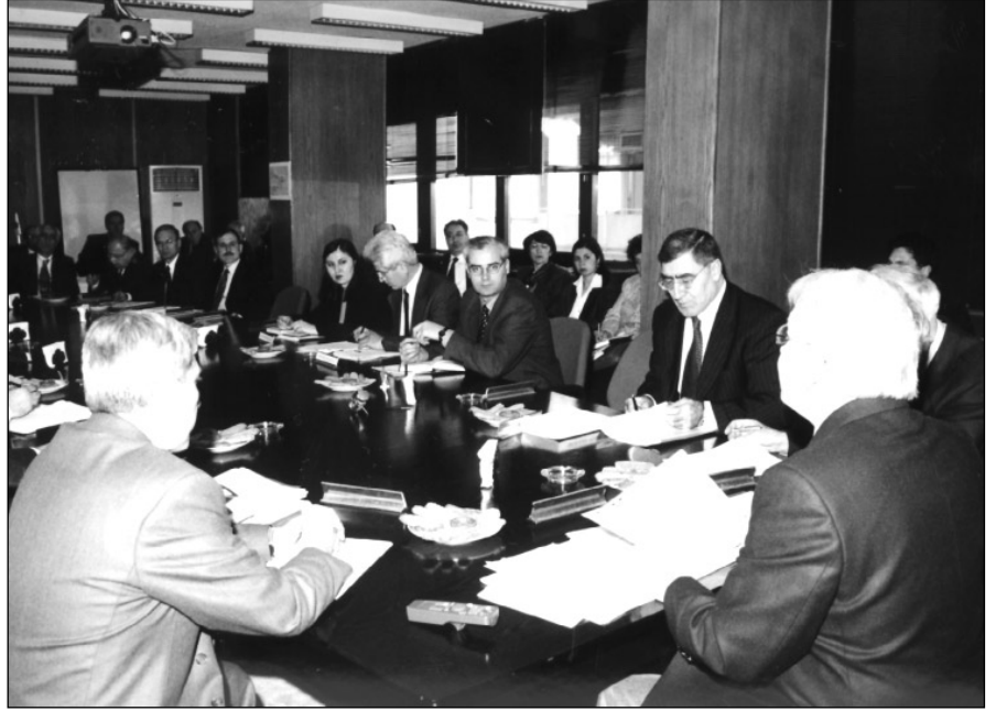
İlgili kuruluş ve üniversite temsilcilerinin katıldığı değerlendirme toplantısı

7. Bilim ve Teknoloji Yüksek Kurulu toplantısında alınan karar gereğince BTYK'ya sunulmak üzere bir rapor hazırlanması amacıyla düzenlenen toplantıya çağırılan kuruluşlar, AB-Çerçeve Programları ve bu programlara katılım bağlamında son iki yıllık gelişmelere ilişkin bir bilgi notunun ışığında, konuyu tüm boyutlarıyla irdeleyen raporlarını TÜBİTAK'a sunmuşlardı.