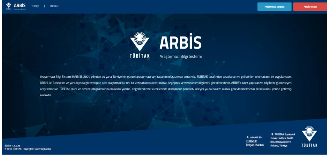
Şekil 2. ARBİS Üyelik Ekranı

2247-C programına başvuru öncesinde Araştırmacı Bilgi Sistemi'ne (ARBİS) kayıt olunması, tüm bilgilerin eksiksiz doldurulması ve güncel tutulması zorunludur. ARBİS kullanıcı hesabı ve şifresi olmayan yürütücüler, https://arbis.tubitak.gov.tr/ adresinden üyelik bilgilerini doldurarak ARBİS şifresi alabilirler (Şekil 2).