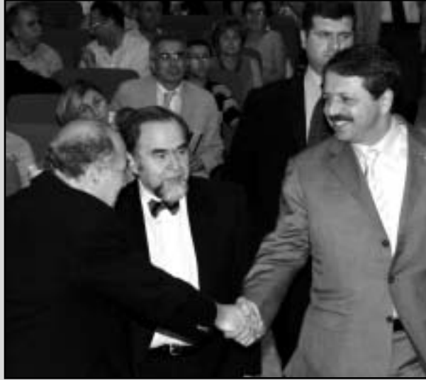
Panelin açılış konuşmasını TOBB Başkanı Rifat Hisarcıkloğlu yaptı

Bu kırk yıllık gelişmeye, TÜBİTAK’ın da önemli ve başarılı katkıları olmuştur. Kuşkusuz bu katkı, TÜBİTAK’ın kuruluş yasasından kaynaklanan kısmi özerklik ile sahip olduğu idari ve mali esneklikler sonucunda gerçekleştirilebilmiştir. Bu iki önemli özellik, yetenekli ve başarılı bir kadro oluşturulabilmesini ve bunun sürekli kılınabilmesini sağlamıştır. Bu yasal statü ile gelişmeye ve çağdaşlaşmaya açık olan TÜBİTAK’ın, siyasal otoritenin de vereceği destekle, bu ülkeye daha nice kırk yıllar başarılı hizmetler vereceğinden hiç kuşku yok”