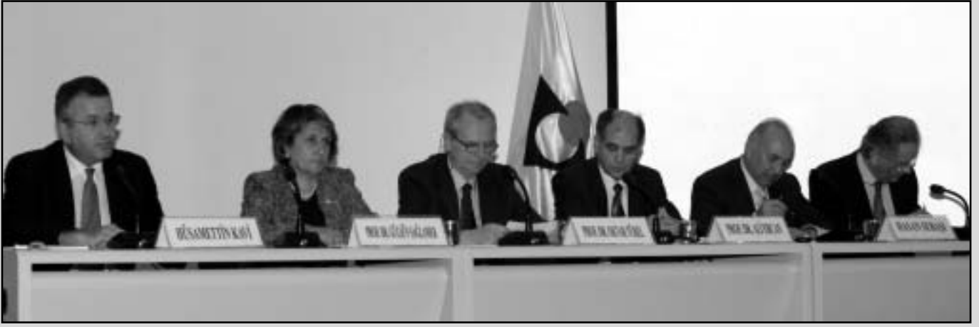
Cumhuriyetin 80. Yılında Bilim ve Teknoloji Paneli