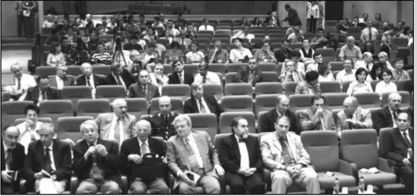
Cumhuriyetin 80. Yılında Bilim ve Teknoloji konulu panelin açılışı